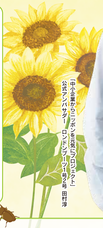
「中小企業からニッポンを元気にプロジェクト」 公式アンバサダー ロンドンフーズ1号2号 田村淳